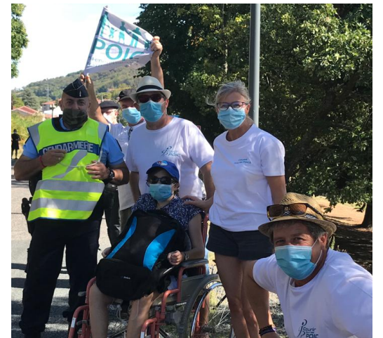
La famille Rège sur le tour de France 2021

Je rappelle à tous que, partout en France ou à l'international, si vous participez ou si des proches participent à des événements sportifs, ceci est possible aux couleurs des POIC. Les tee-shirts techniques sont disponibles sur simple demande et nous nous ferons un plaisir de diffuser leur reportage sur les réseaux.